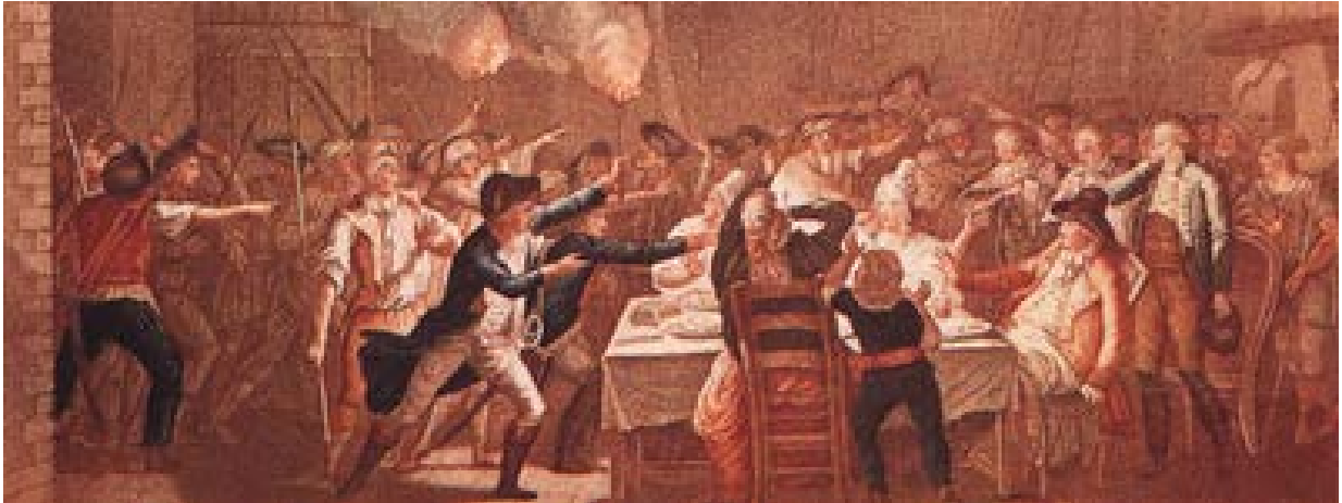
Arrestation du roi Louis XVI à Varennes