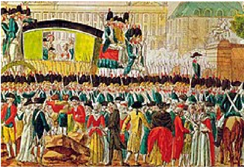
Le roi est ramené à Paris