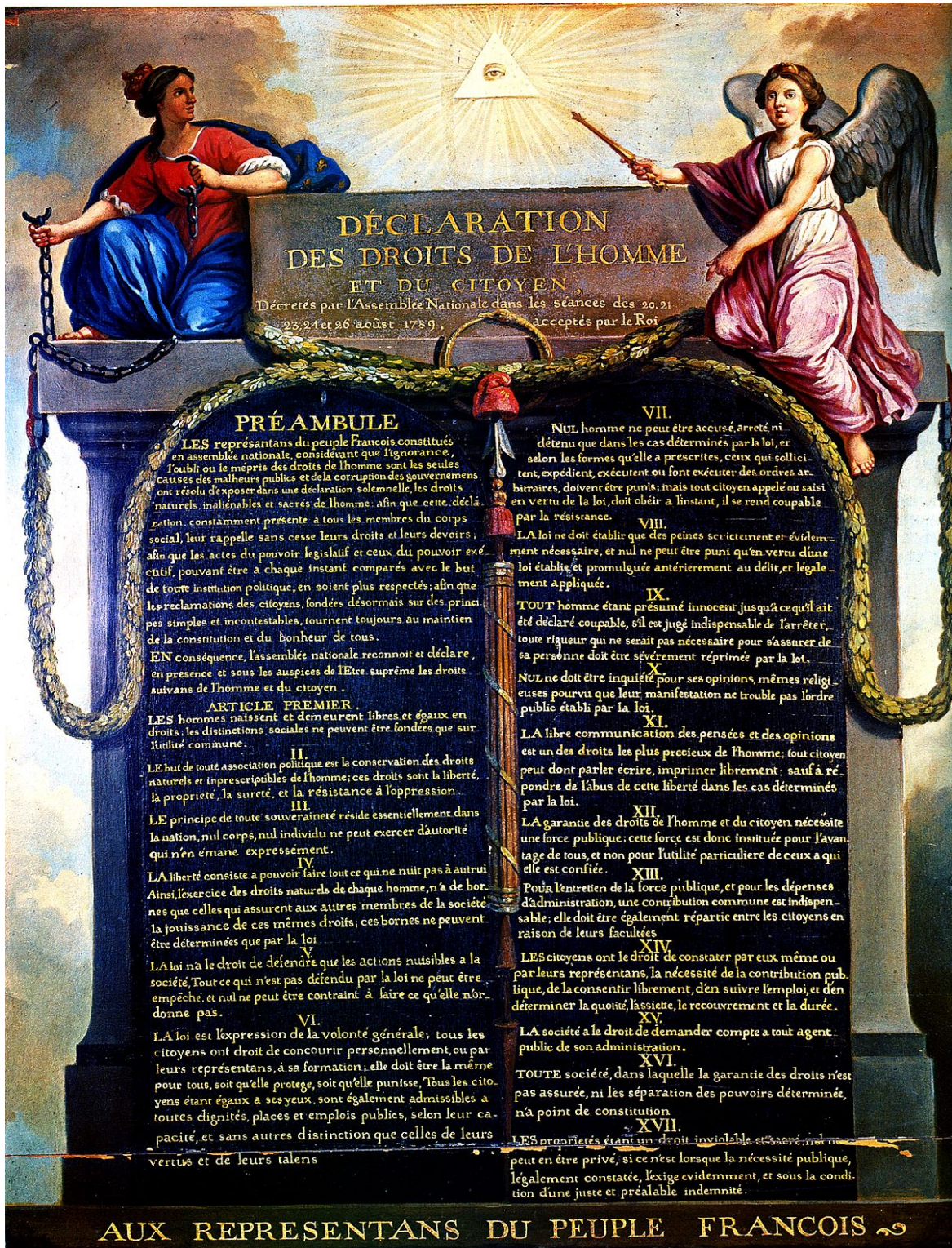
La Déclaration des Droits de l'Homme et du Citoyen, du 26 août 1789