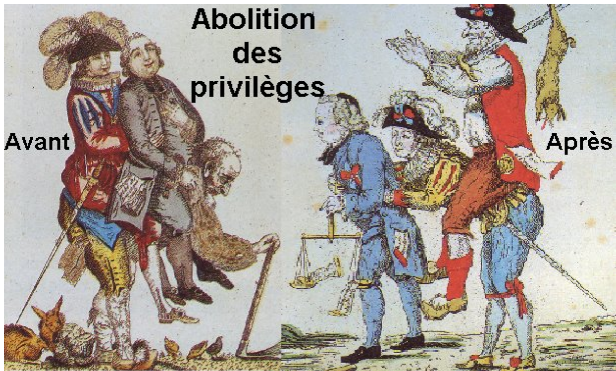
Abolition des privilèges, le 04 août 1789